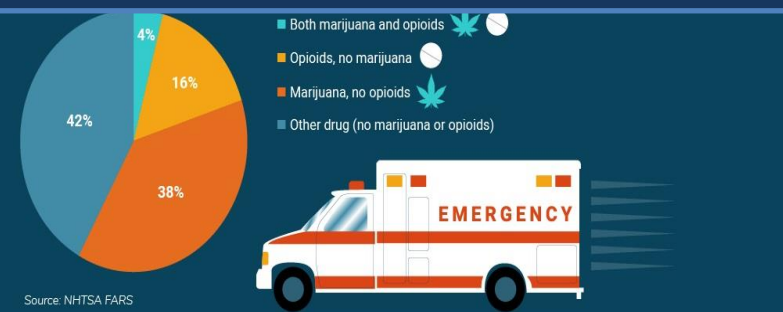
Source: NHTSA FARS